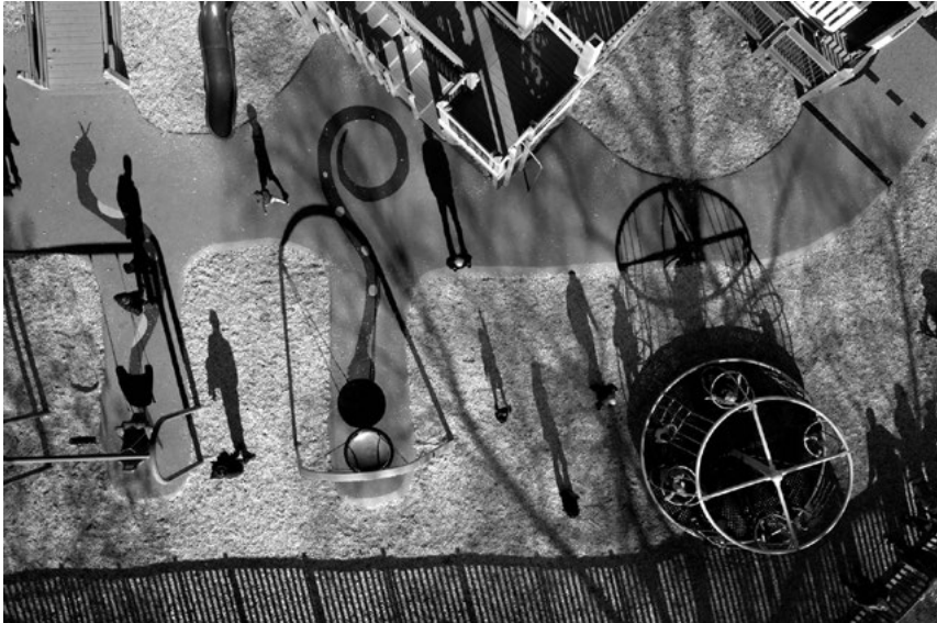
Figur 8.2 «A playground seen from above in Sacramento County, California».

Bildet er estetisk tilfredsstillende og til og med vakkert komponert, men framstår trass i motiv og uttrykk som urovekkjande i si distansering, gitt den samanhengen vi no har vorte øvt i å sjå det i.